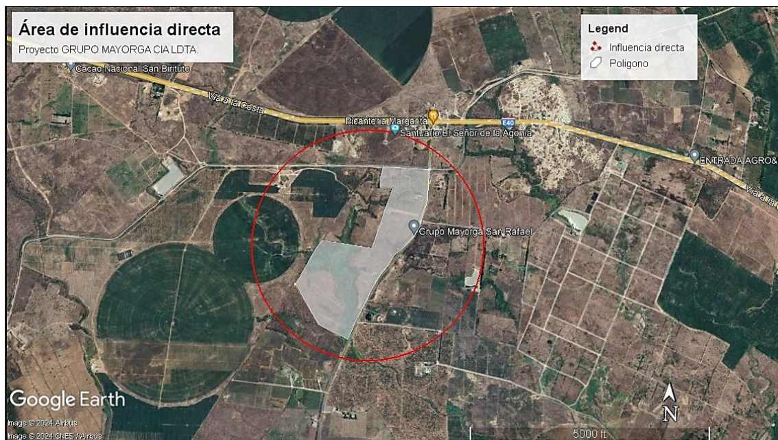
Figura 1: Área de Influencia Directa